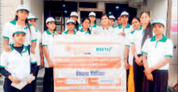
को मेकअप, हेयर स्टाइलिंग, स्किन केयर एवं ब्राइडल मेकअप सहित विभिन्न तकनीकों का व्यावहारिक एवं सैद्धांतिक ज्ञान प्रदान किया गया। शादी के इस सीजन में प्रशिक्षित युवतियों को

ग्रामीण स्वरोजगार को बढ़ावा देने के उद्देश्य से ग्रामीण स्वरोजगार प्रशिक्षण संस्थान द्वारा जिले की 23 युवतियों को 16 मार्च 2026 तक 35 दिवसीय ब्यूटी पार्लर प्रशिक्षण प्रदान किया गया। प्रशिक्षण पूर्ण होते ही युवतियों को कार्य के अवसर मिलने लगे हैं, जिससे उनकी आर्थिक स्थिति सुदृढ़ हो रही है। प्रशिक्षण प्राप्त 23 युवतियों में से 18 युवतियों ने तत्परता दिखाते हुए स्वयं का ब्यूटी पार्लर कार्य प्रारंभ कर दिया है। प्रशिक्षण के दौरान प्रतिभागियों