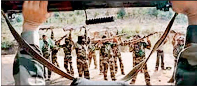
केंद्र सरकार के निर्देश का करेंगे पालन यह निर्णय भारत सरकार के गृह मंत्रालय द्वारा पूर्व में जारी (2013 एवं 2022) नक्सलियों के आत्मसमर्पण एवं पुनर्वास कार्यक्रम के दिशा-निर्देशों के परिपालन में लिया गया है। केंद्र सरकार की नीति के बिंदु 6.2 के अनुसार, कोई भी नक्सल केन्द्र जिला मजिस्ट्रेट, एसपी, रेंज डीआईजी, या अन्य अधिसूचित अधिकारियों के समक्ष आत्मसमर्पण करने के लिए स्वतंत्र है।

किया है। छत्तीसगढ़ शासन ने राज्य में वामपंथी उग्रवाद के खत्म और नक्सलियों के मुख्यधारा में लौटने की प्रक्रिया को और अधिक सुदृढ़ बनाने के लिए एक महत्वपूर्ण कदम उठाया है। सरकार के गृह विभाग (सी-अनुभाग) द्वारा जारी इस नवीन आदेश के तहत, अब नक्सल प्रभावित जिलों के जिला पुलिस अधीक्षकों को आत्मसमर्पण करने वाले माओवादियों द्वारा दी गई जानकारी और विवरण को लेखबद्ध करने तथा उसे अद्यतन (अपडेट) करने के लिए आधिकारिक रूप से नामांकित किया गया है।